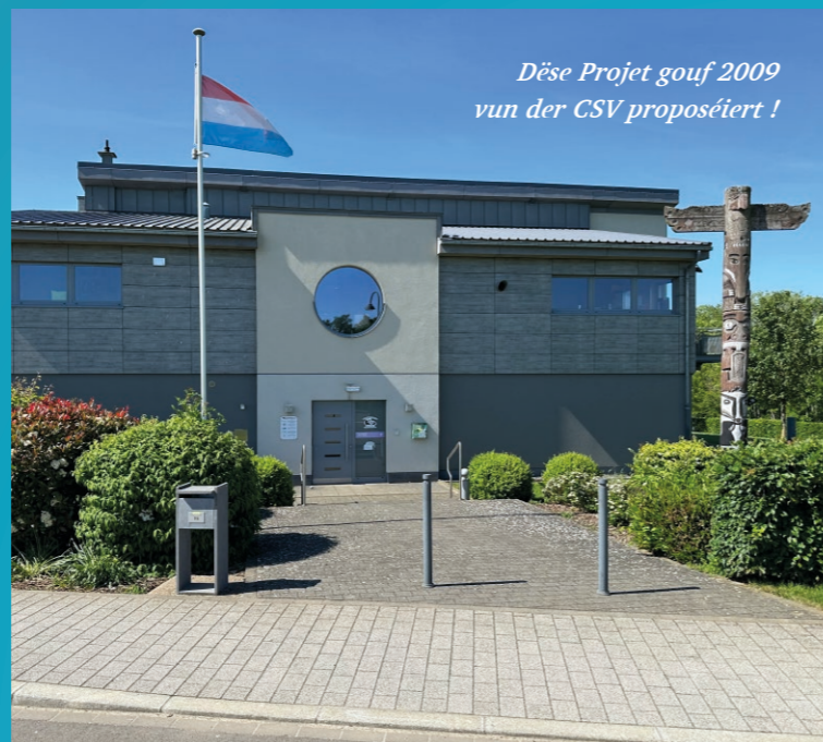
Dëse Projet gouf 2009 vun der CSV proposéiert !

En plus, le campus scolaire est également attenant à la nature et même à un petit bois que la commune a acquis il y a quelques années.